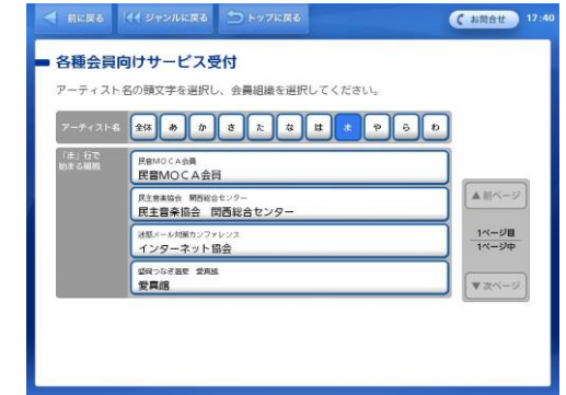
④「な」行「新潟アルビレックスバスケットボール後援会先行販売」を選択