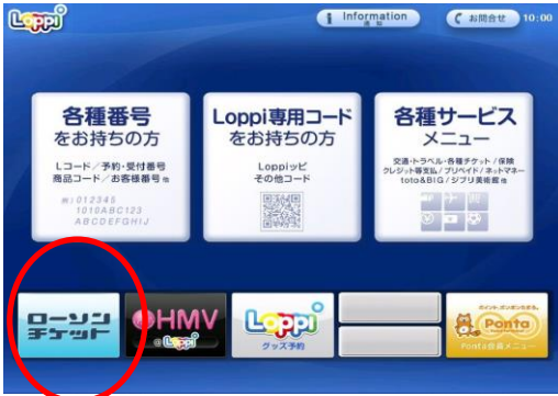
①「ローソクチケット」を選択

◆ローソン・ミニストップ店頭にある端末「Loppi」での予約引換方法 ※①～⑮の手順で操作ください