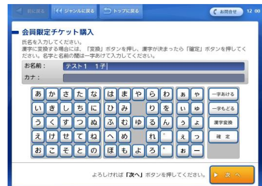
⑩お名前を入力し、 ⑪次にお電話番号を入力