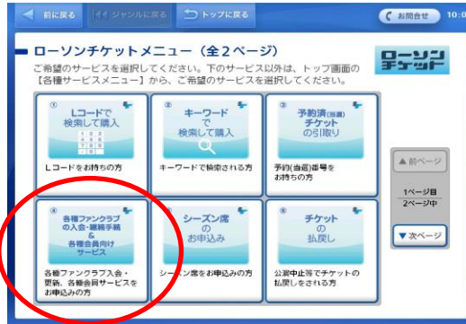
②「各種ファンクラブの入会・継続&各種会員向けサービス受付」を選択