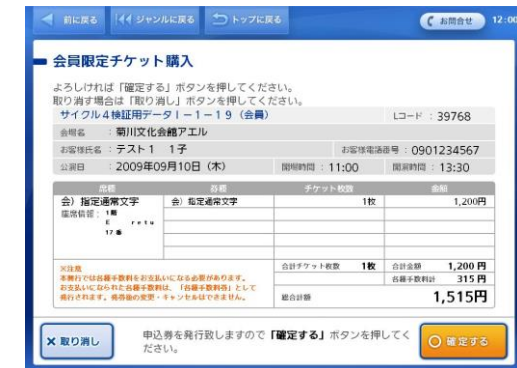
⑬申込内容を確認し確定を押す ⑭「はい」を選択 ⑮申込券がでてくるので、お申込券をレジへ レジにて代金精算後、チケットと引換

※1 後援会会員番号の 下四桁 を2度入力下さい。例：会員番号が「RBP-0111」であれば「01110111」を入力。