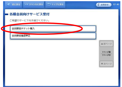
⑥「会員限定チケット購入」を選択